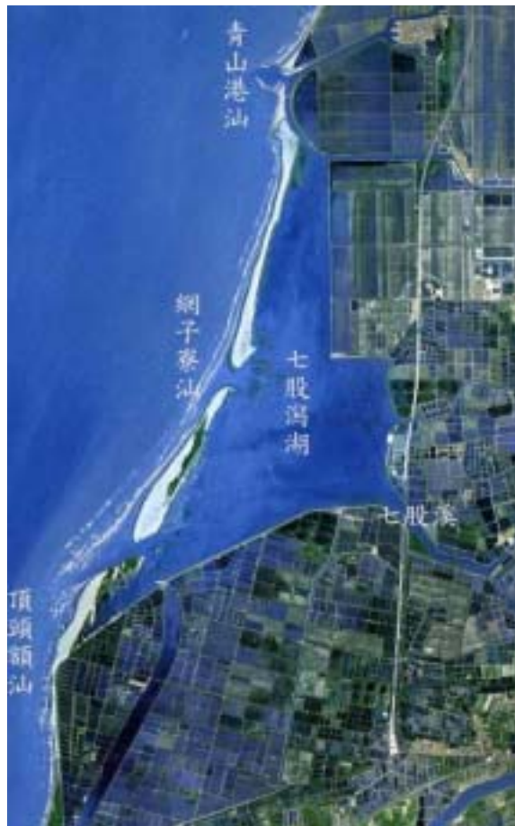
圖 1 七股潟湖衛星影像(修改自國立中央大學太空遙測中心印製之 2006 年月曆，影像日期不明)

沙洲和其背後的潟湖在海岸地形上是一個不可分割的環境系統，常合稱為洲潟海岸系統(barrier-lagoon system)。潟湖由於前面有沙洲的保護，可免除波浪的直接影響，在環境上是屬以潮汐作用為主的較低能量水域，七股潟湖內的沈積物主要以極細砂和粉砂為主，局部有中砂出現，整體分佈明顯受到潮流作用的控制。七股潟湖外側的網子寮汕沙洲近十年來地形變遷快速，新舊潮口的形成與閉合變動頻繁，也因此使得潟湖內部的潮流運動模式跟著產生變動。由於潟湖介於沙洲和陸地之間，是兼具漁業生產、生物多樣性及安全防護功能的重要環境，深入了解潟湖環境的沈積作用與地形動力是在擬定海岸保護及海岸永續經營管理策略時必備的知識，外側沙洲的遷移及潮口的變動如何影響潟湖內沈積物的沈積搬運過程與地形變遷，值得關切。